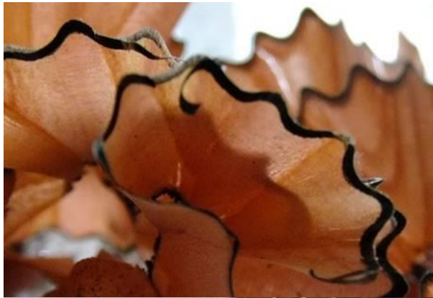
Holzspäne vom Anspitzen